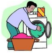
Laver le linge