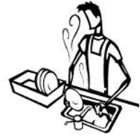
Faire la vaisselle