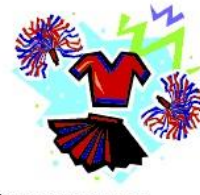
Ranger ses affaires