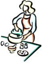
Faire la cuisine