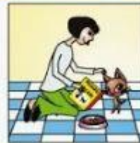
Je nourris le chat.