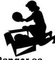
Ranger sa chambre