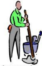
Laver le sol