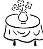
Desservir la table