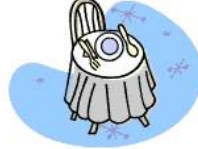
Mettre la table