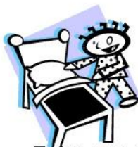
Faire son lit