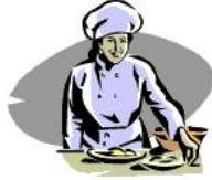
Préparer le repas