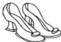
Les Talons Hauts