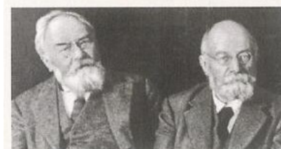
André et Édouard Michelin

Qu'est-ce que c'est ? Devine ! C'est comment ? C'est un petit objet ? Non, il est grand. Il est en bois ? Non. Il est en papier ? Oui, il est en papier. Il est carré ? Oui, presque. Il est cher ? Il coûte 10 couronnes. Il est de quelle couleur ? Il est rose ? Non, il est bleu. Il est lourd ? Non, il est léger. C'est pour l'école ? Oui, c'est pour l'école. C'est un cahier ? Oui ! Gagné ! C'est un cahier.