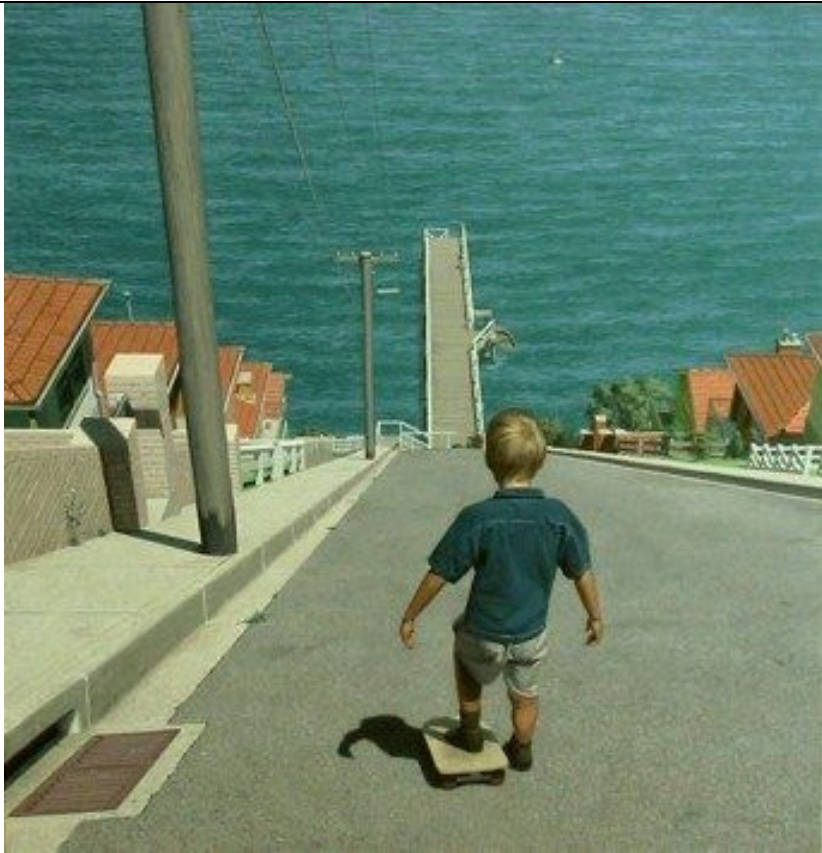
till prov classe 3; ht2010; prov 1;